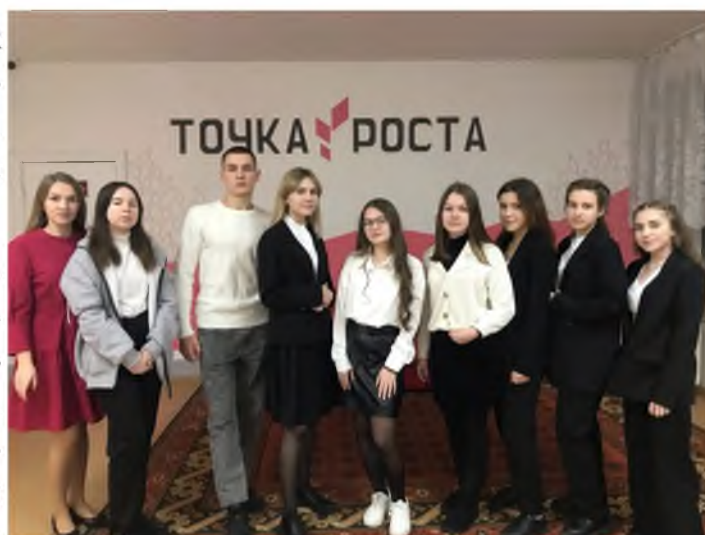
Команда победителей МР «Койгородский»

«Народный бюджет в школе»—это выявление и поддержка проектной активности объединений обучающихся, направленной на сотрудничество обучающихся, педагогов, родителей с местным сообществом, способных разрабатывать и совместно реализовывать социально значимые проекты.