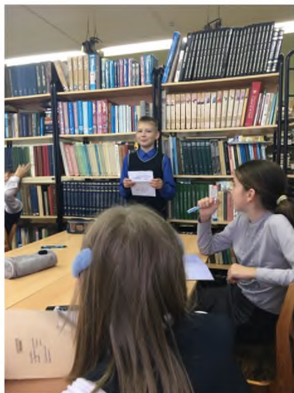
Обучающиеся объединения «Большая перемена»