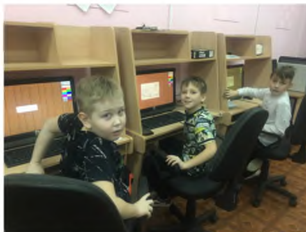
Обучающиеся объединения «Компьютерный мир»