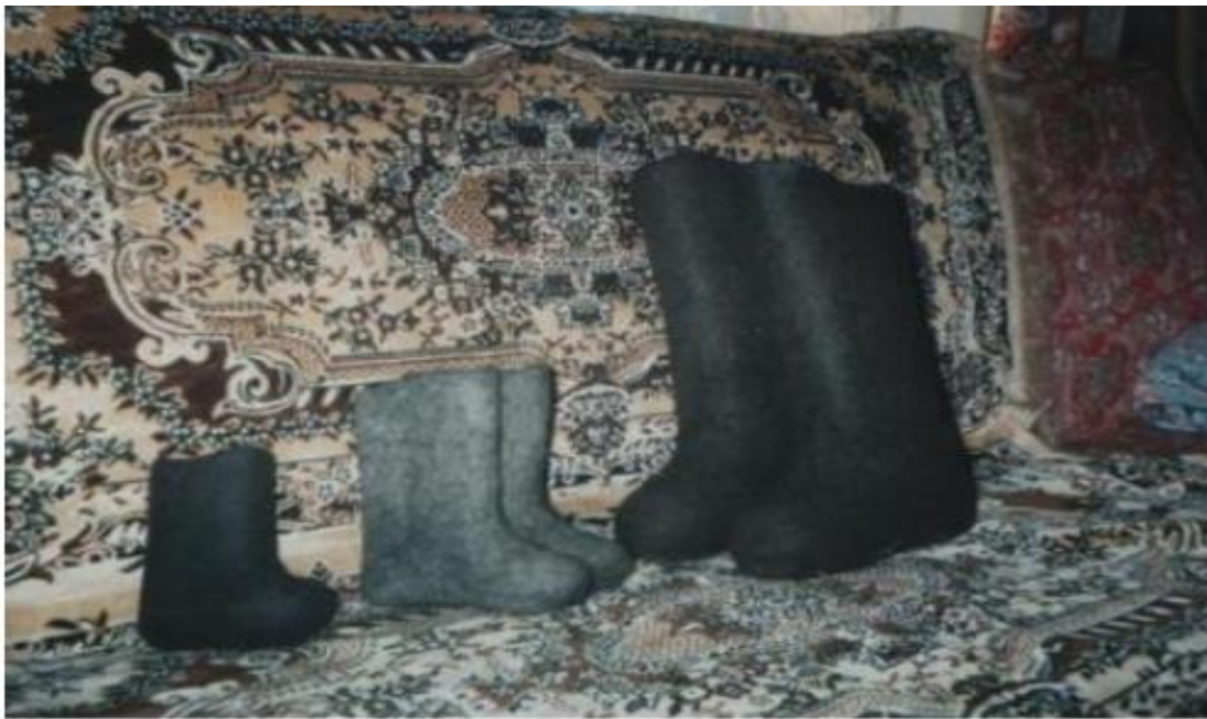
Валенки разных видов