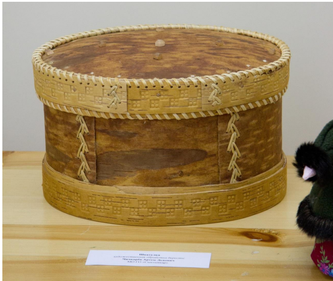
История Культурного наследия Музея «Домашний музей» История